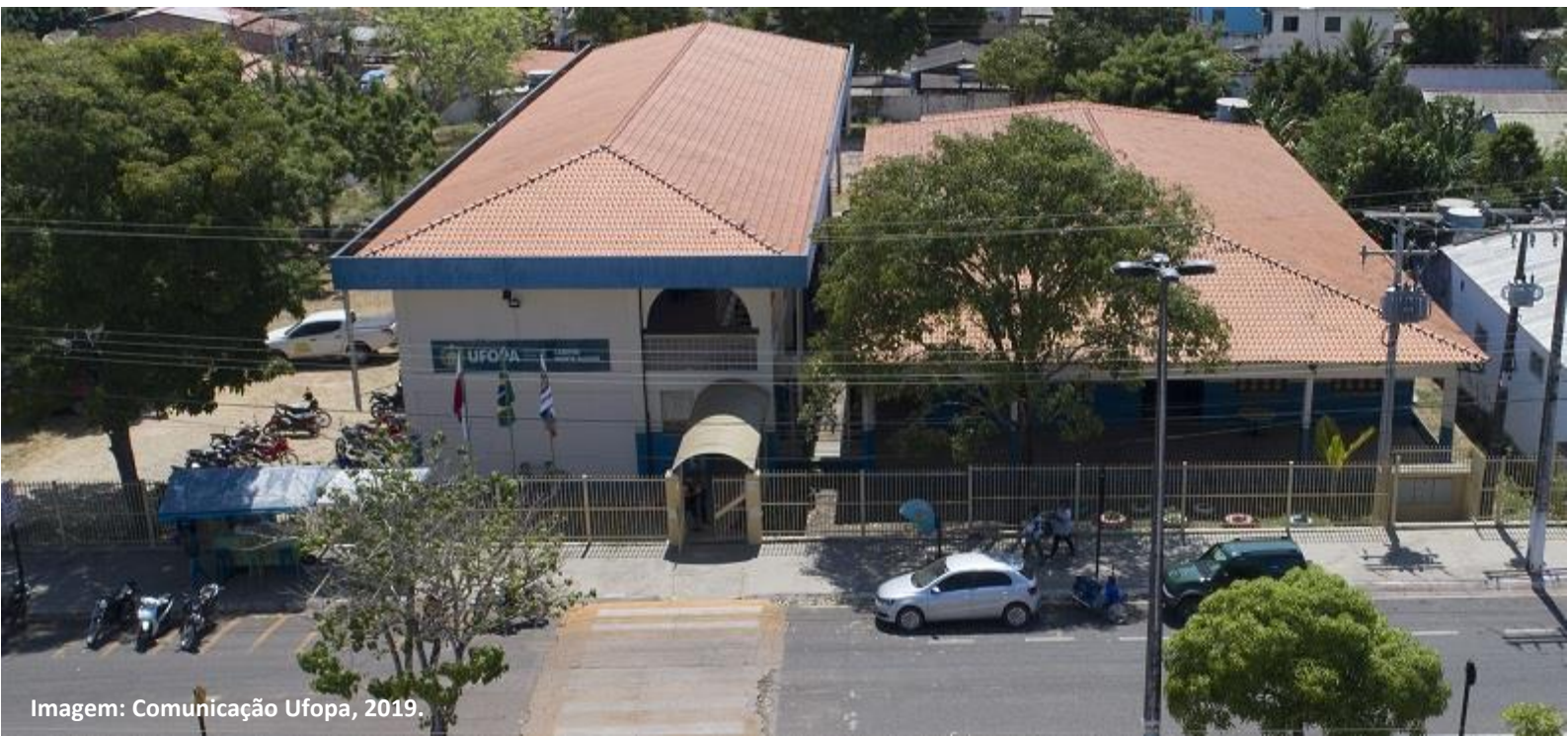
Imagem: Comunicação Ufopa, 2019.